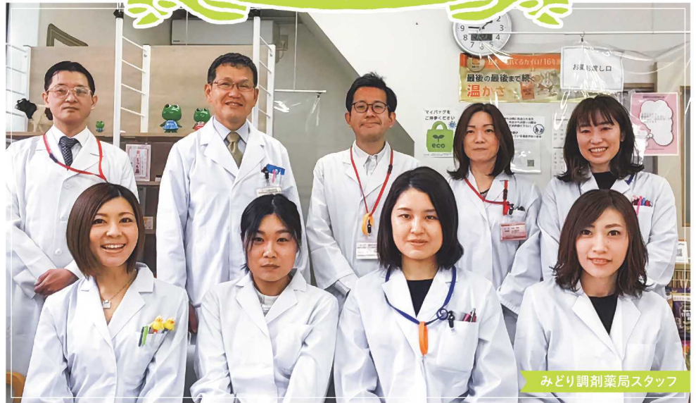
みどり調剤薬局スタッフ

「くすり」と笑える健康を。 愉快なスタッフが待っています! みんなどこまで知ってる? かかりつけ薬局のすすめ