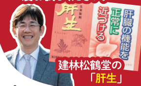
建林松鶴堂の「肝生」

12種類の生薬が働き肝臓の機能を元気にしてくれます!!二日酔いにも効果バツグンですので、ぜひ一度お試しください!